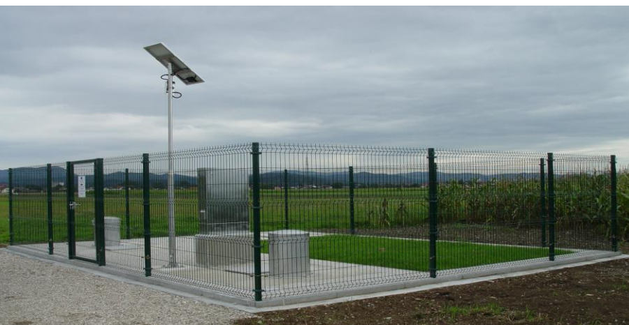
Samodejno meilno mesto za podzemno vodo v Mengšu

Na Agenciji RS za okolje so 8. julija 2016 predstavili zaključek projekta Bober - največjega projekta za spremljanje stanja vodnega okolja v Sloveniji. Ime Bober je kratica za B oljše O pazovanje za B oljše E kološke R ešitve (angl. Better Observation for Better Environmental Response).