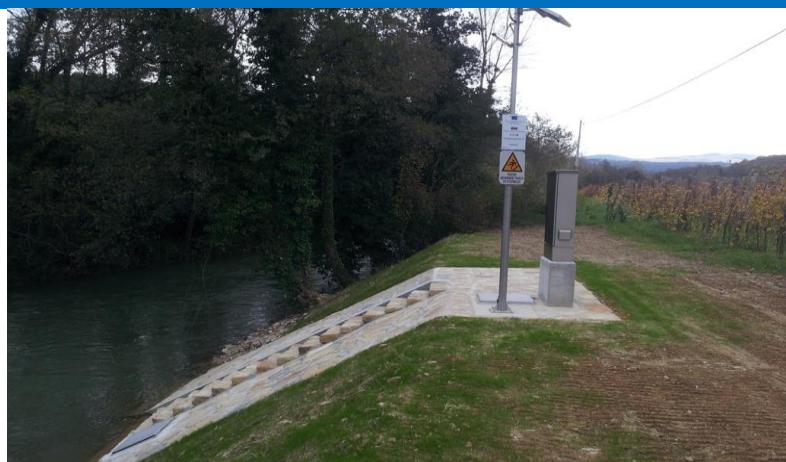
Merilno mesto Dekani-Rižana