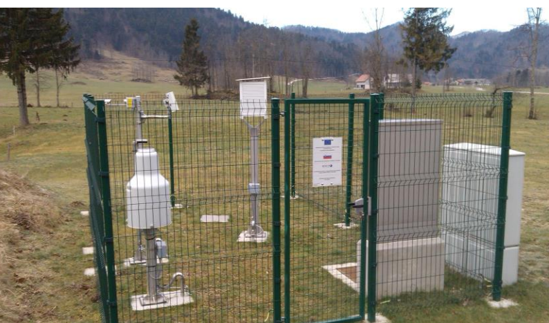
Samodejno meteorološko merilno mesto