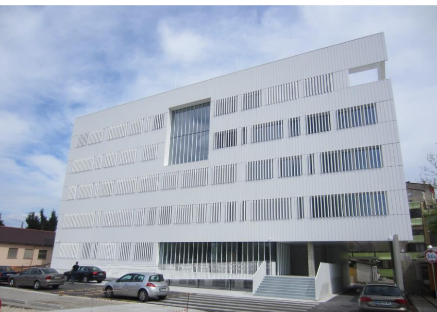
Laboratorijski prizidek Agencije RS za okolje