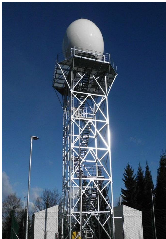
Vremenski radar na Pasji ravni