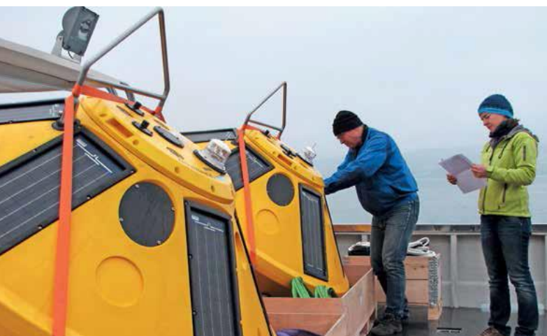
Postavitev dveh oceanografskih boj

Več o projektu si lahko preberete v brošuri .